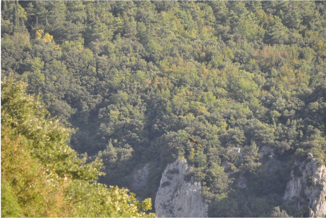
Nibbio reale in volo nella Gola di Frasassi