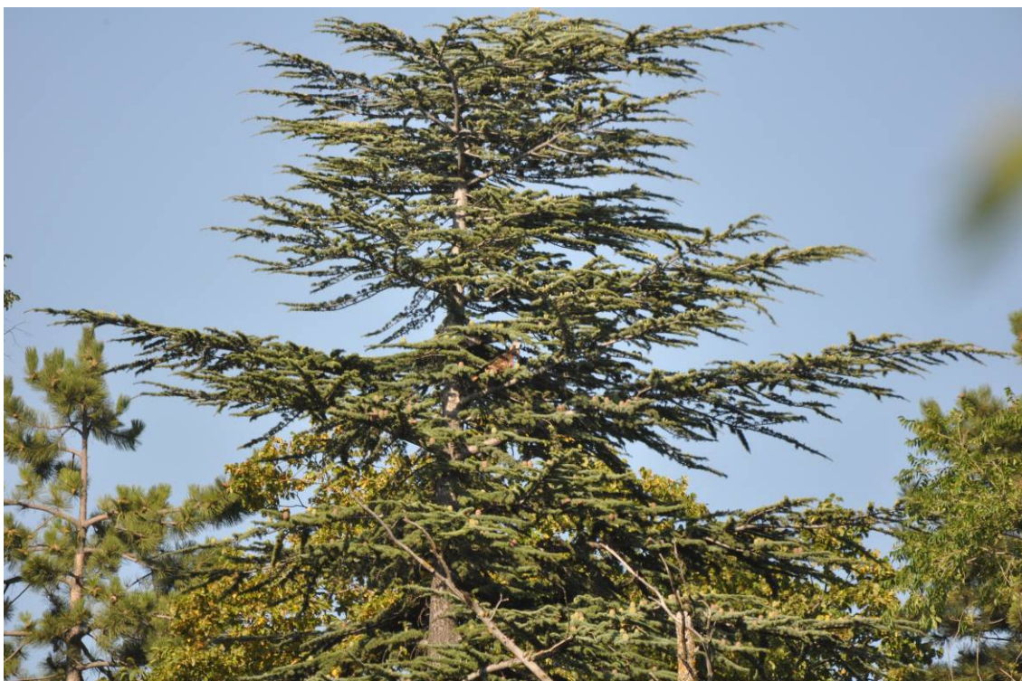
Nibbio reale IHZ posata sopra un cedro del Libano