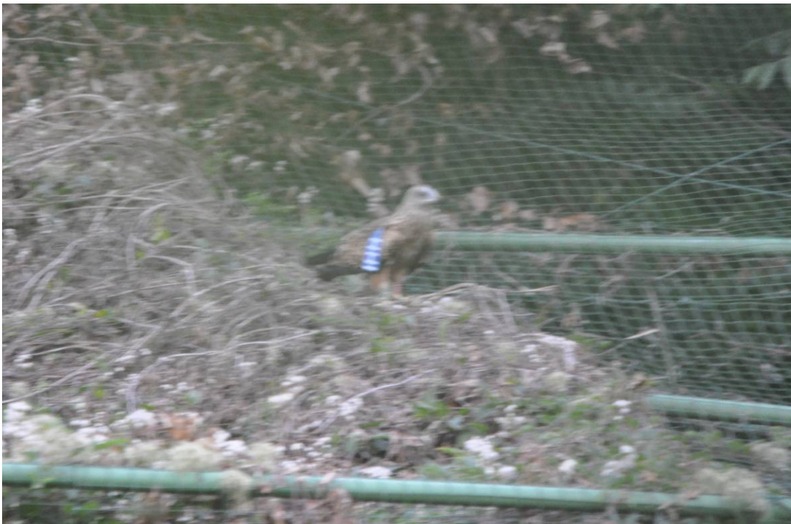
Nibbio reale IHH posato sopra la voliera