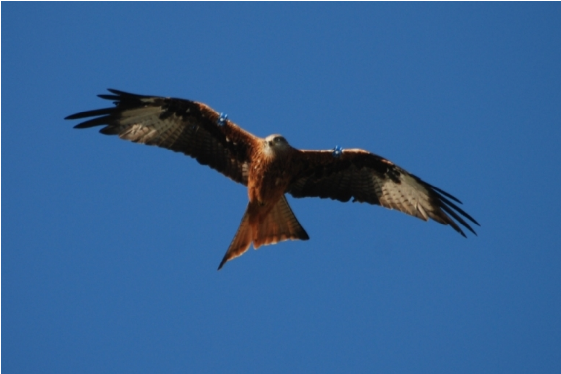
Nibbio reale IJJ fotografato in Basilicata il 3/11/2011