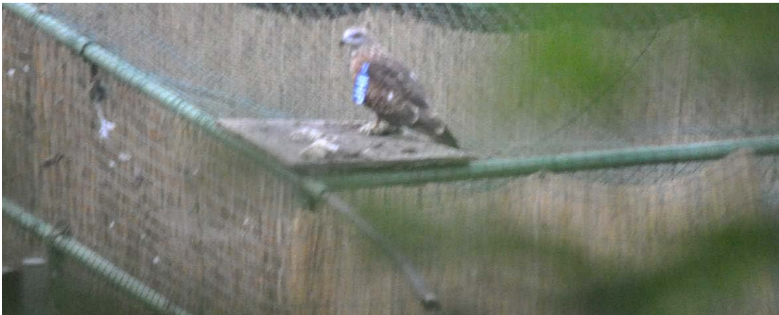
Nibbio reale IHP posato sopra la voliera di rilascio